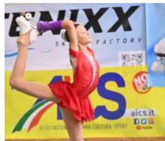
VerdeAzzurro 2024, 48° Rassegna nazionale di pattinaggio artistico