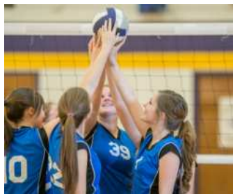
VerdeAzzurro 2024: campionato nazionale di Pallavolo AiCS