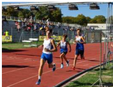
VerdeAzzurro 2024, 58° Campionato Nazionale AiCS di Atletica Leggera e 1° Campionato paralimpico nazionale