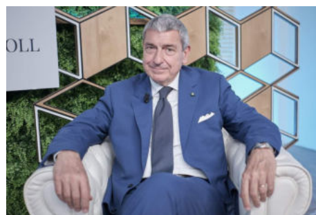
Molea, su centro “Don Pino Puglisi”: impedirne la chiusura

“Le istituzioni sottoscrivano con Asilo Savoia un patto sociale di comunità