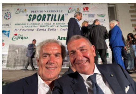
Premio Sportilia, AiCS premia Roberto Donadoni

Questa sera nel Salone dei Cinquecento a Firenze: ricostruzioni storiche e spettacolo di teatro danza, da “Le vite” di Giorgio Vasari – POSTI TUTTI ESAURITI, EVENTO GRATUITO