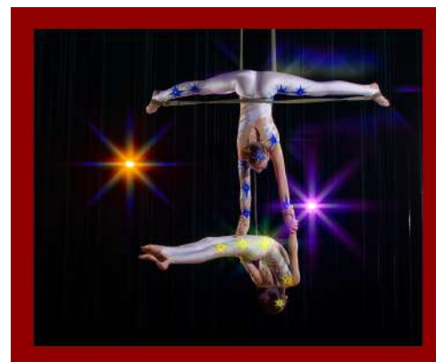
Corso di Formazione per Operatori e Tecnici Sportivi di discipline acrobatiche circensi