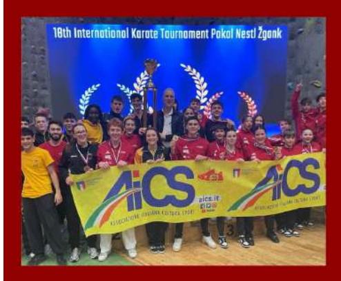
Karate, la rappresentativa AiCS si distingue al 18° Torneo Internazionale di Karate "Pokal Nestl Žgank Velenje"