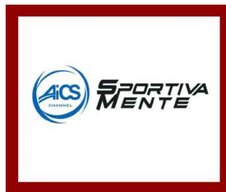
SportivaMente, il rapporto Antigone su carcere e minori e la risposta del Terzo Settore