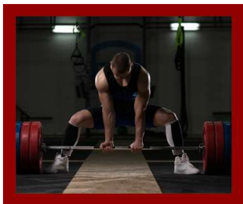
Corso di Formazione per Istruttore di Pesistica – Cultura Fisica Powerbuilding